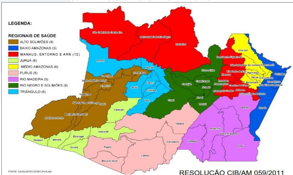
FIGURA 2: REGIÕES DE SAÚDE DO AMAZONAS