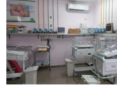
UCINCA / UCINCO