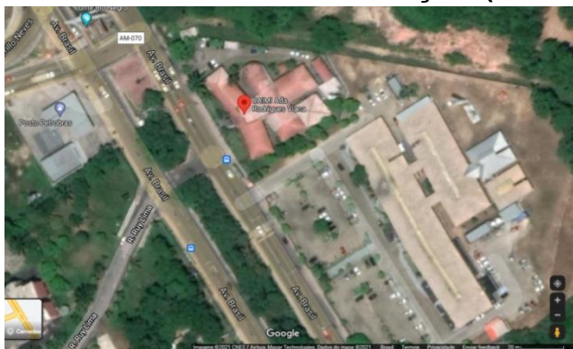
IMAGEM AÉREA DA LOCALIZAÇÃO (MAPA)